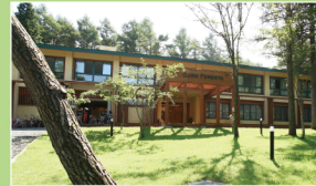
CARO FORESTA (山中湖)