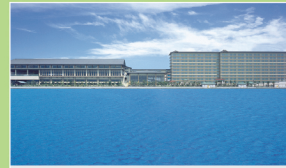
龍宮城スパホテル三日月 (木更津)