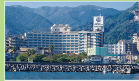
ホテル大野屋 (熱海)