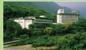
湯本富士屋ホテル (箱根)