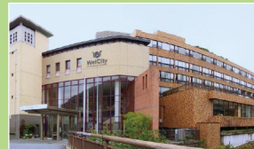
ニューウェルシティ湯河原 (湯河原)