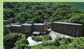
ホテル南風荘 (箱根)